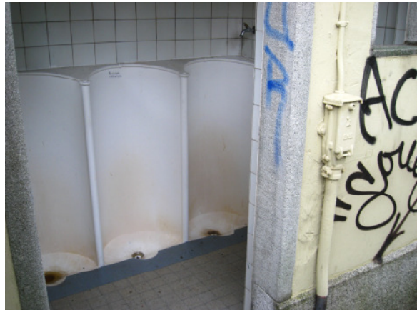
Öffentliche Toilettenanlage Breitematte: Aktuelle Situation